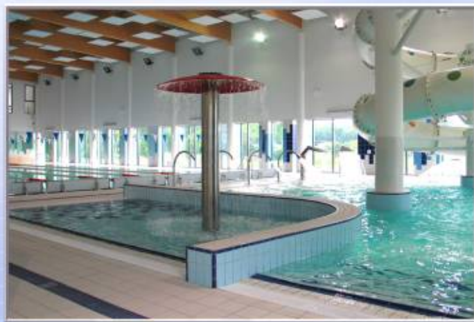
Park Wodny w Radziejowie