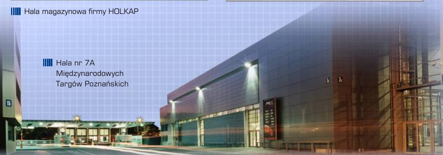
Hala nr 7A Międzynarodowych Targów Poznańskich