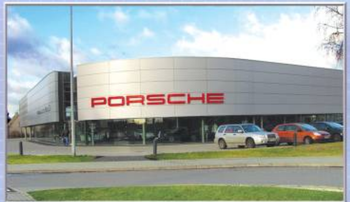
Salon oraz Centrum Serwisowe PORSCHE w Poznaniu