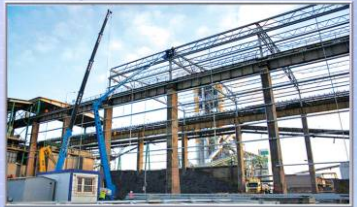
zakłady surowców i klinkieru Lafarge