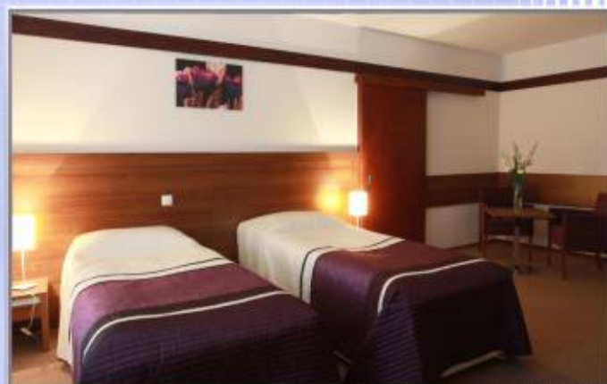
■■■■ Kompleks hotelowo-rekreacyjny OLENDER w Wielkiej Nieszawce