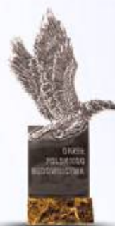
Orzeł Polskiego Budownictwa