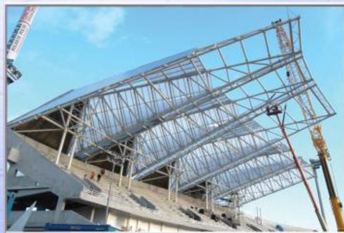
Stadion Stali w Rzeszowie