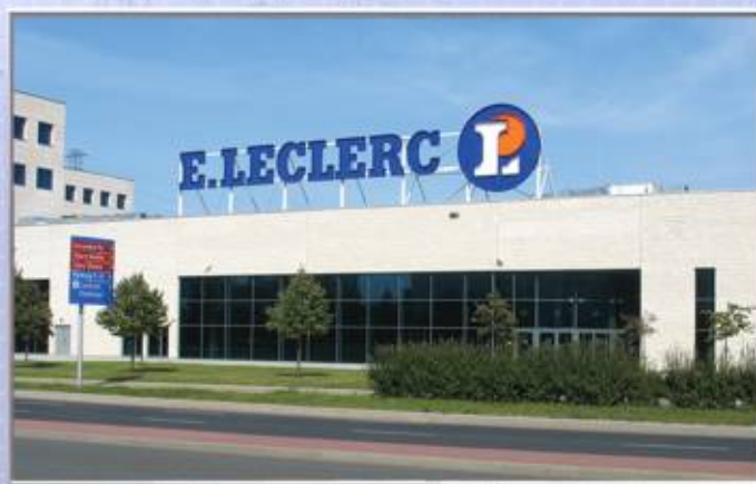
■■■■ Biurowiec oraz supermarket E.Leclerc