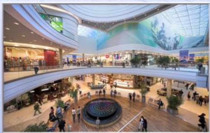
■■■■ Galeria Malta Zakres prac: dostawa i montaż konstrukcji stalowej