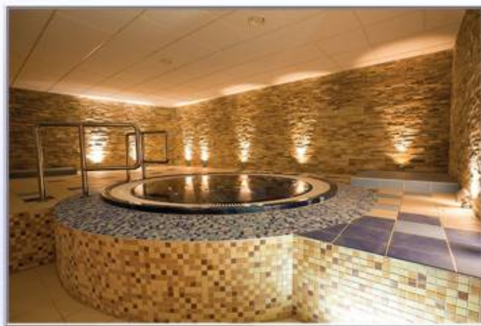
Centrum Sportu i Rekreacji OLENDER w Wielkiej Nieszawce