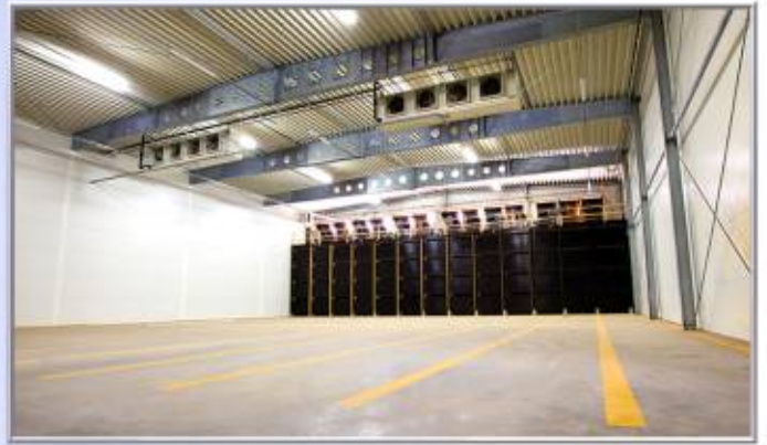
Przechowalnia warzywa Kujawskiej Grupy Producentów Warzywa Groblewskich w Lipiu