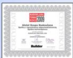
Budowlana Firma Roku