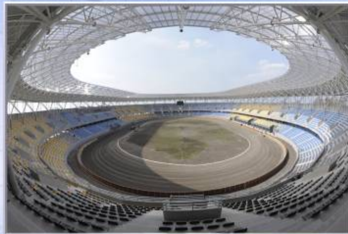
Największy stadion żużlowy w Polsce – Motoarena w Toruniu