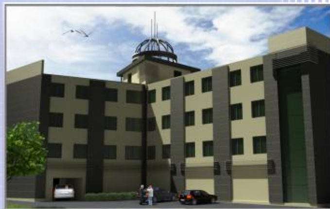
■■■■ Budynek usługowo-biurowy w Inowrocławiu