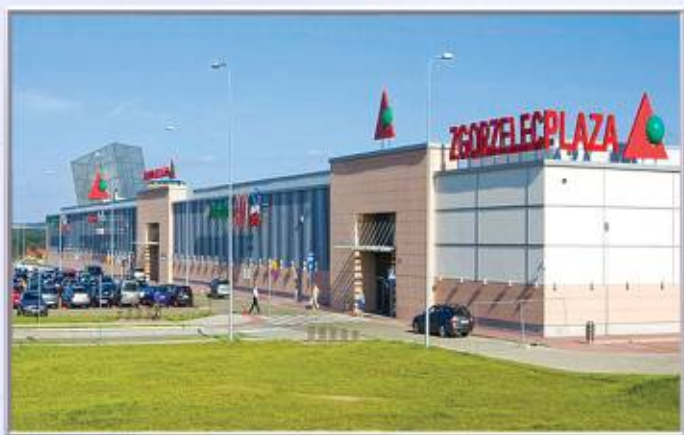
■■■■ PLAZA Zgorzelec Zakres prac: dostawa i montaż konstrukcji stalowej

W celu świadczenia najwyższej jakości usług zatrudniliśmy najlepszych specjalistów, którzy realizowali obiekty m.in. dla Focus Mall, Auchan oraz Leroy Merlin .