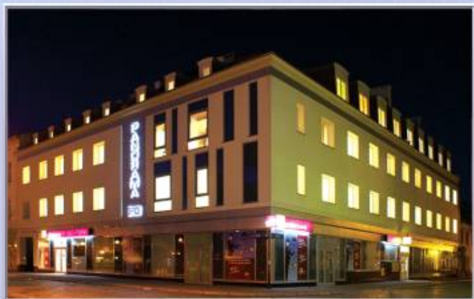
■■■■ PANORAMA OFFICE - Biurowiec w Inowrocławiu