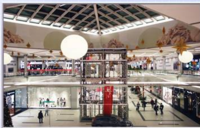
■■■■ PLAZA Toruń Zakres prac: dostawa i montaż konstrukcji stalowej