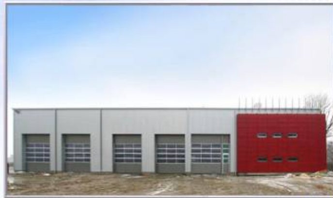
|||| WIZET – hala warsztatowa firmy WIZET Transport