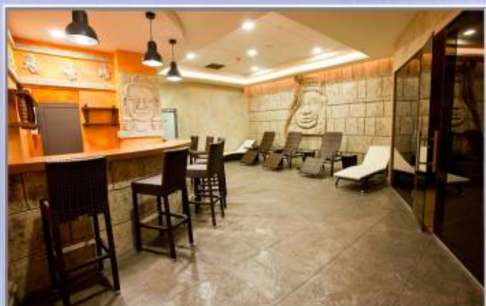
■■■■ Kompleks rekreacyjno-sportowy Termy Maltańskie w Poznaniu