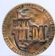
Firma na Medal