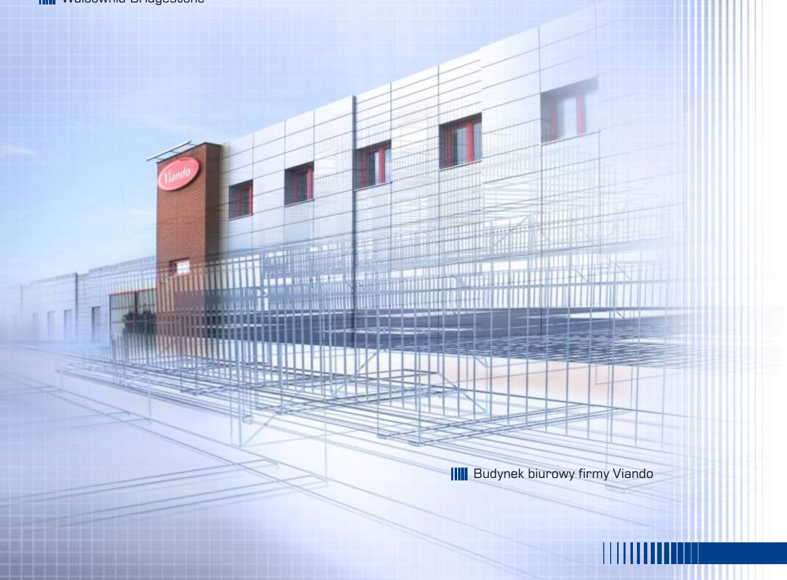
|||| Budynek biurowy firmy Viando